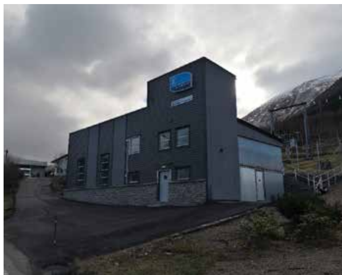
Omfattende rehabilitering av Uskedalen transformatorstasjon ble fullført høsten 2018. Vellykket prosjekt på alle måter som styrker forsyningsikkerheten i Kvinnherad kommune.