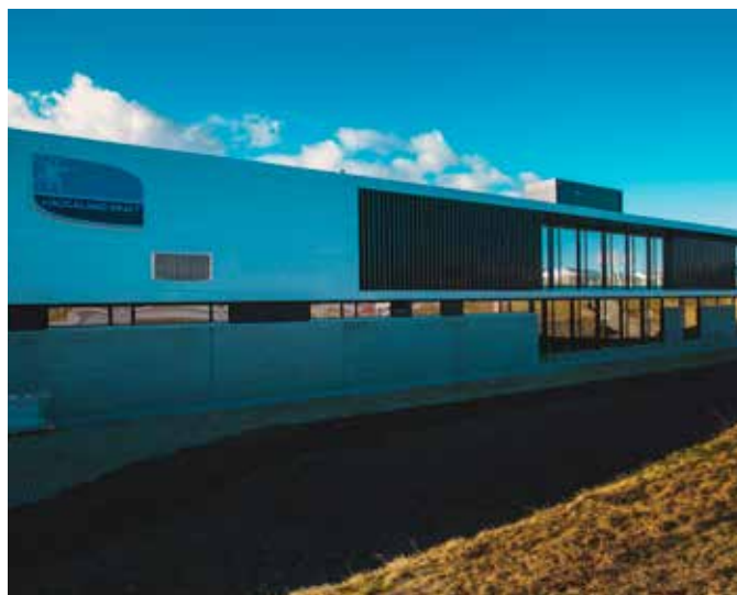
Vårt nye bygg på Heiane Stord er bygget med solcelleanlegg på taket, batterianlegg og smarte elbilladere.