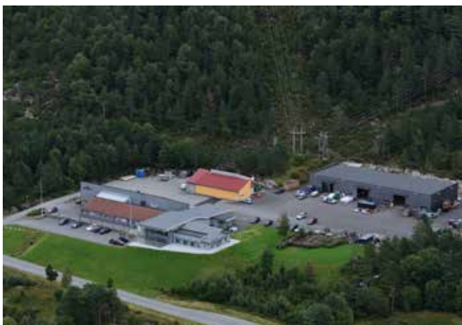
Her ser vi bilde fra våre bygninger i Årskog på Fitjar.