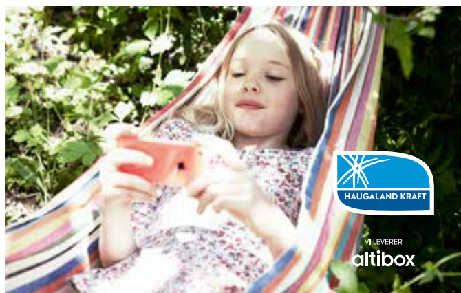
I 2018 lanserte vi ny hyttepakke med 80 Mbit linje og den nye Altibox TV-plattformen.