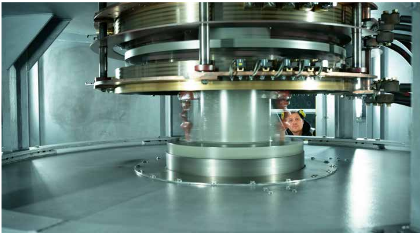
Det er store krefter i sving når generatoren i Blåfalli Vik går rundt med 333 omdreiningar i minuttet.