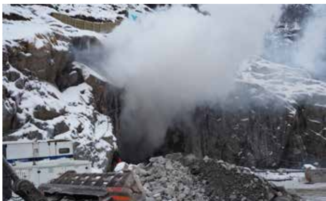
Røyken veltar ut etter ei vellukka sprenging i tilløpstunnelen ved Løkjelsvatn kraftverk.