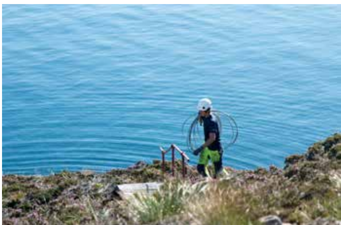
Å være energimontør innebærer mange og varierte arbeidsoppgaver.