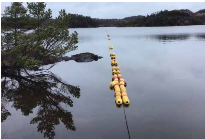
Legging av fibersjøkabel i Vigdarvatnet i Sveio.