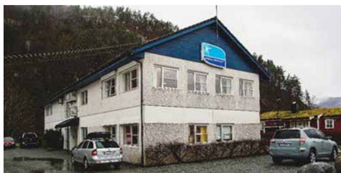
Haugaland Kraft avdeling Sand i Suldal kommune. Tidligere Suldal Elverks lokaler.